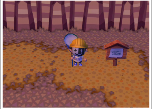
画像は銀のあみです